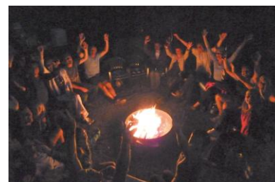
bis spät in die Nacht.