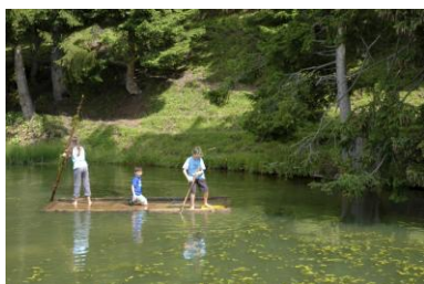
Viel Spaß mit dem Floß ...