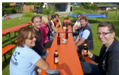
gemütliches Beisammensein ...